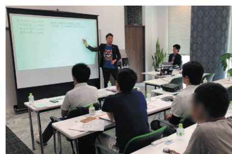
同社では、不動産投資に関するセミナーを毎月実施。物件選びから購入後の管理まで、詳しい説明を行っている

キャピタルゲイン（売却益）ではなく、長期で家賃収入を得るインカムゲイン狙いの手法を